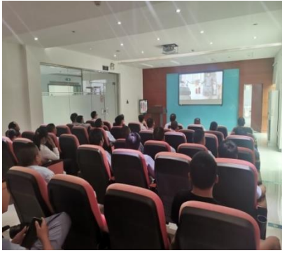
事故案例影片撥放

為建立同仁製程安全的重要性，中山廠遂實施危險化學品安全風險防範教育訓練，以播放他廠實際災害事故影片作為借鏡，並同時增進同仁危害辨識及危機感，更重要的是從每個案例中檢討事故發生原因及廠內相關因應改善對策，再由主管進行經驗分享及互動式討論，以達到教育訓練之目的