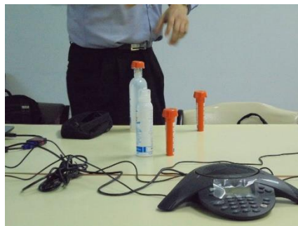
敵腐靈噴劑使用說明