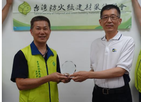
感謝獎牌頒贈合影