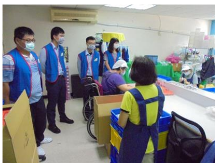
手工皂製作流程介紹