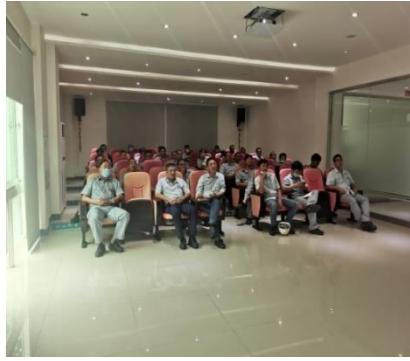
事故案例影片播放