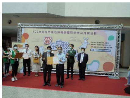
市長頒贈前鎮廠感謝狀