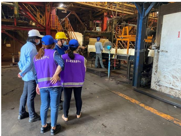
現場作業環境訪視

台達化遵守相關職業安全衛生法規，保障員工之合法權益，重視員工健康並提供健檢補助，並提供良好的工作環境及強化友善工作環境。中區勞工健康服務中心於 8 月份到廠訪視，其訪視人員包含職業醫學科專任醫師、勞工健康服務護理師及職衛管理師，訪查目的為針對廠內勞工健康服務推行概況的瞭解與輔導。