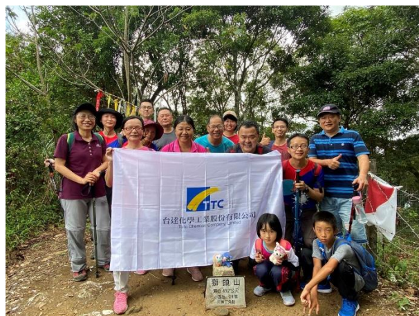
獅頭山基點合影留念