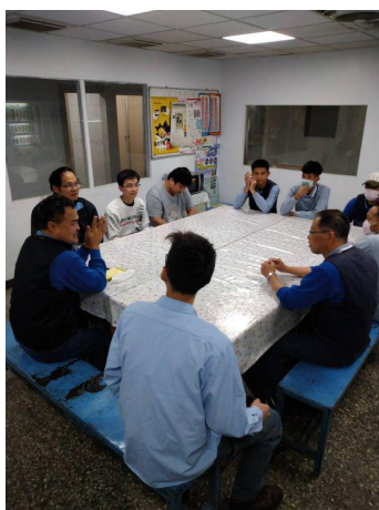
春安期間精神重點提示