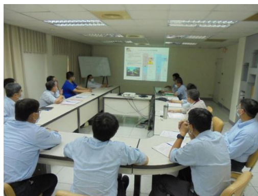
防衛駕駛教育訓練