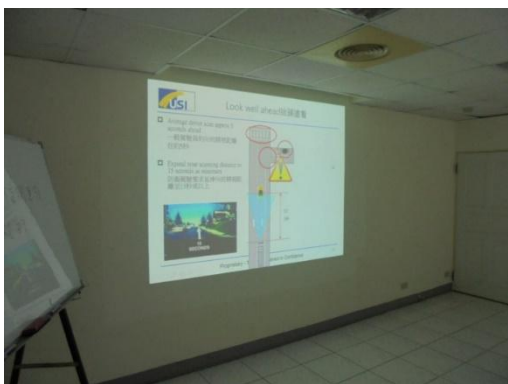
防衛駕駛教育訓練

台達化前鎮廠重視員工通勤安全，特辦理防衛駕駛教育訓練強化員工正確行車駕駛觀念，期望員工在每次行車均能平安抵達目的地，本次訓練人數 20 人，出席率達 100%。