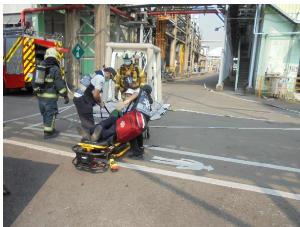
受傷人員送醫作業