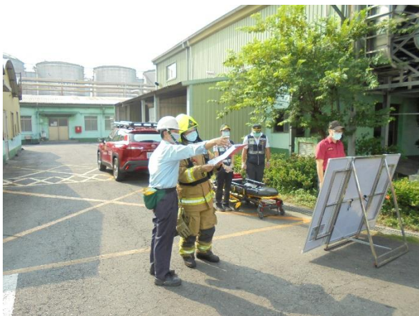
工廠人員向指揮官提供危害辨識卡及解說

本次演練目的在於火警發生時，在消防人員抵達前，廠區啟動消防自衛編組，採取有效自衛消防活動，確實發揮早期預警及有效避難引導之功能，並透過平時演練，使消防人員能落實火場管制及善用救災裝備進行搶救，降低廠區及人員災損。