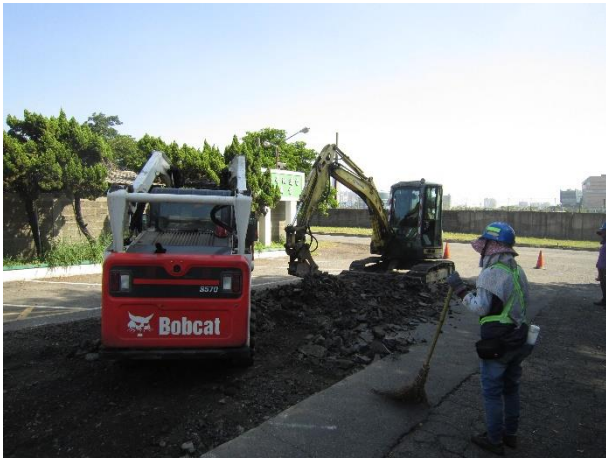
柏油路面刨除鋪設

台達化前鎮廠周邊柏油路面已長時間使用失去黏結性，導致路面崩解及龜裂破損，經評估後於 10 月上旬委由廠商刨除破損路面，重新鋪設以提升用路人行車安全及廠內員工上下班安全。