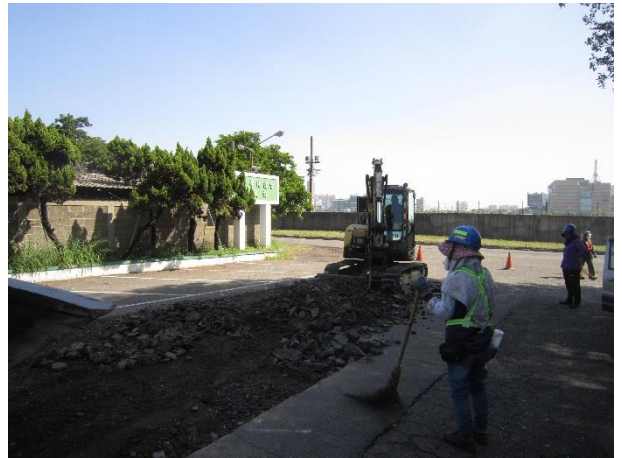
柏油路面刨除鋪設