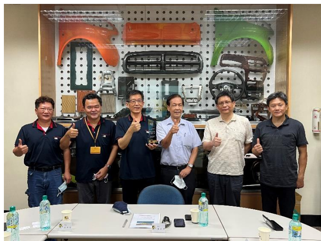
工研院專家學者至頭份廠進行實地複審作業

台達化頭份廠榮獲經濟部節能標竿獎入圍殊榮，主因為公司對節能減碳推動工作的支持以及頭份廠每位同仁主動做好節能工作，從導入 ISO 50001 能源管理系統，針對廠內能源種類及耗能量進行盤查，依設備老舊程度、能效改善及影響耗能量原因找出優先改善的項目等...不放棄任何節能的機會。台達化頭份廠推動一系列節能措施，不僅減少能源使用，同時降低溫室氣體排放，積極朝友善台灣、永續經營目標前進。