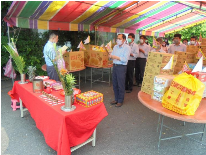
各廠區舉行普渡祈福作業

台達化公司為減少空氣汙染並配合環保政策，其中元普渡紙錢統一集中送至各縣市指定之焚化廠統一燒化，以減少懸浮微粒、一氧化碳、臭味及落塵產生。