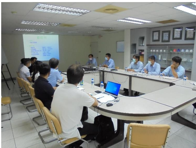
達慧互聯公司 AI 應用討論會議

台達化前鎮廠近年來為實現 AI 結合 ESG 管理應用，故與達慧互聯公司針對節能減碳、工安環保及預知保養等應用進行探討，期望藉由 AI 應用開發使廠區從數據收集、資料匯入及分析到應用上線，在推動數位轉型的契機下提升產業競爭力。