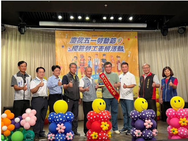
頭份廠模範勞工代表領獎

員工是公司重要的資產，為感謝員工的付出與貢獻，頭份廠工會於勞動節前夕提名優秀員工參與苗栗縣模範勞工公開表揚，但因疫情造成慶祝勞動節暨模範勞工表揚大會延宕。此次獲獎員工在人際關係圓融、具備優秀溝通能力達成公司交付任務，且在工作崗位克盡職守為公司創造成長，透過表揚活動給予鼓勵，並激勵其他員工一同為自己也為公司努力。