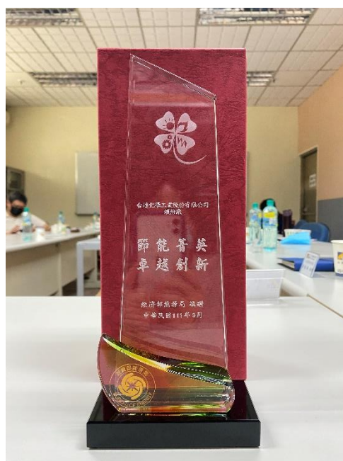
經濟部能源局頒發入圍獎牌