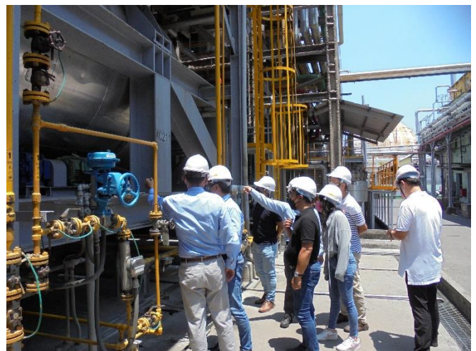
廠區 AI 應用現勘作業