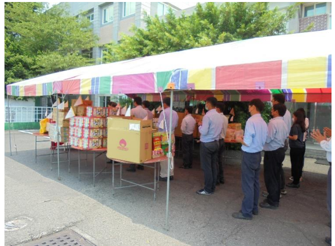
各廠區舉行普渡祈福作業