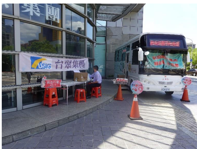
台聚集團大樓 1 樓廣場捐血活動集合處

近年因疫情緣故，使得捐血人數大幅降低，全台血庫持續拉警報，身為台聚集團一份子，台達化公司致力於善盡企業社會責任，員工踴躍至台聚大樓 1 樓廣場前挽袖捐血。