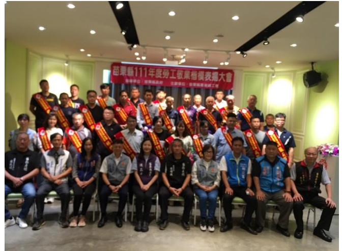
全體模範勞工合影