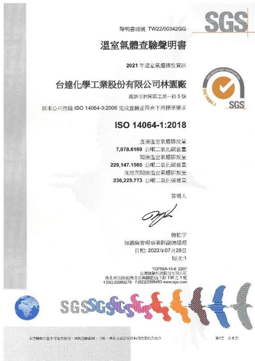
台達化林園廠 ISO 14064-1 溫室氣體排放查證證書

因應全球暖化造成氣候變遷加劇，台達化公司持續建構永續經營管理，與集團 2030 年減排 27% 目標連結，於 2022 年起頭份廠、林園廠及前鎮廠已全面導入 ISO 14064-1 溫室氣體排放盤查，並取得第三方溫室氣體排放查證證書。