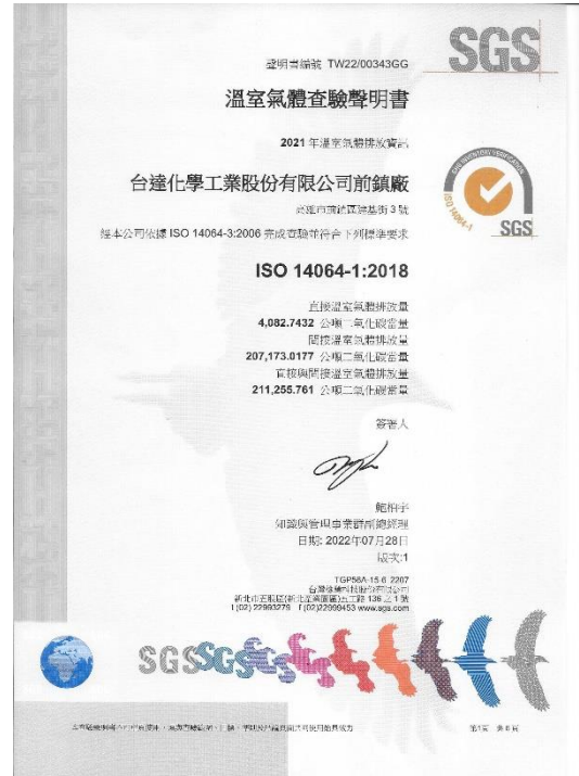
台達化前鎮廠 ISO 14064-1 溫室氣體排放查證證書