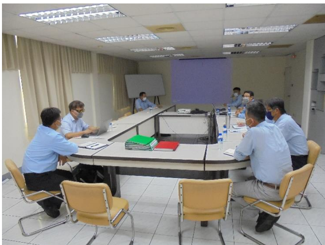
SGS 進行 ISO 50001 能源管理系統定期審查

鑑於全球淨零排放浪潮與歐美碳邊境調整機制趨勢，且響應政府的能源管理政策，台達化公司已導入 ISO 50001 能源管理系統並於 2022 年 10 月份完成 ISO 50001：2018 定期審查作業，透過 PDCA 管理循環模式，提升能源使用效率，減少溫室氣體排放，同時量測並監督能源的使用，以實踐永續經營之目標。