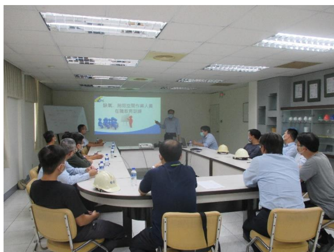
缺氧、局限空間作業人員之教育訓練