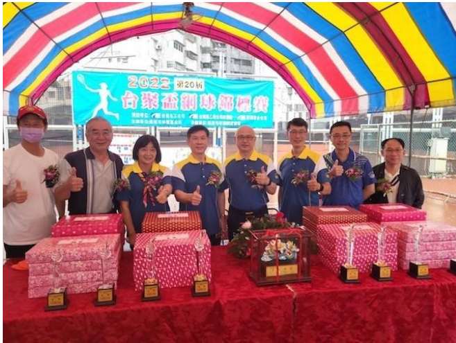
台聚集團各廠參與網球錦標賽代表合影

台達化林園廠參加第 20 屆台聚盃網球錦標賽，連同集團友廠台聚、亞聚、台氯、華聚等友廠一同切磋交流球技，除平時工作之交流，亦藉由活動來促進集團各廠同仁間之情誼。