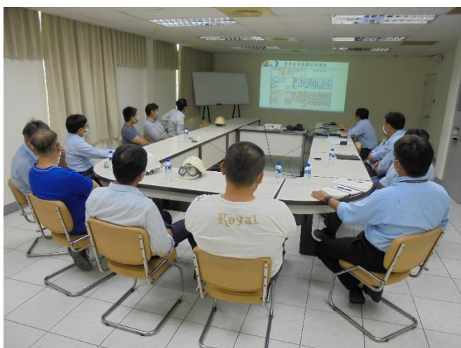
缺氧、局限空間作業人員之教育訓練

台達化前鎮廠為使廠內同仁確實瞭解缺氧、局限空間作業，以避免工安事故之發生，故於 111 年 10 月份辦理每梯次 3 小時共 4 梯次之缺氧、局限空間作業人員之教育訓練，其包含法規介紹、作業安全事項、常見危害及事故案例分享等內容，以強化缺氧、局限空間作業同仁對於危害辨識之能力，減少職業災害發生。