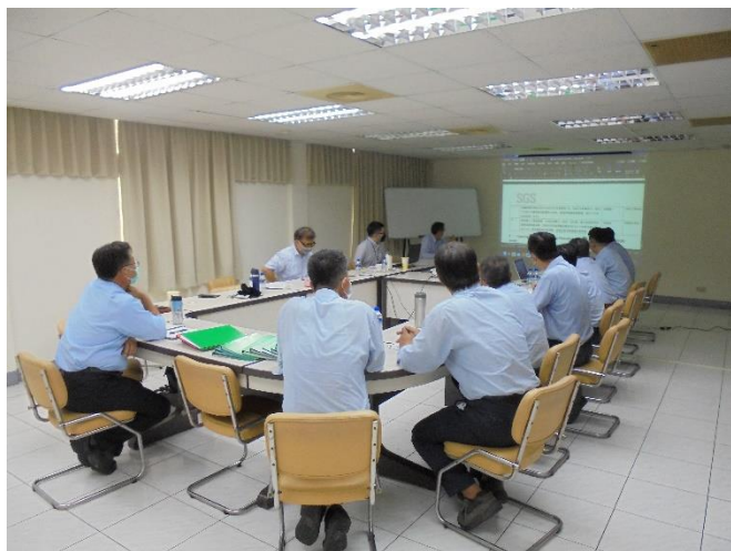
SGS 進行 ISO 50001 能源管理系統定期審查