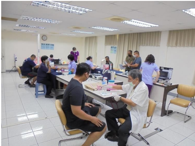
前鎮廠年度員工健康檢查

台達化公司秉持「員工為公司最重要資產之理念」，且致力於建構健康且友善職場，故於每年度均會辦理優於法規要求之員工健康檢查及項目，前鎮廠於 10/5 及 10/7 辦理兩梯次員工健康檢查，健檢後提供每位同仁可向臨場專業醫護人員諮詢之服務，使同仁能更為瞭解身體狀況，達到早期發現早期治療之目的。