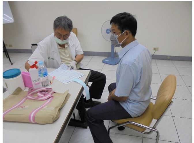
前鎮廠年度健康檢查醫師問診