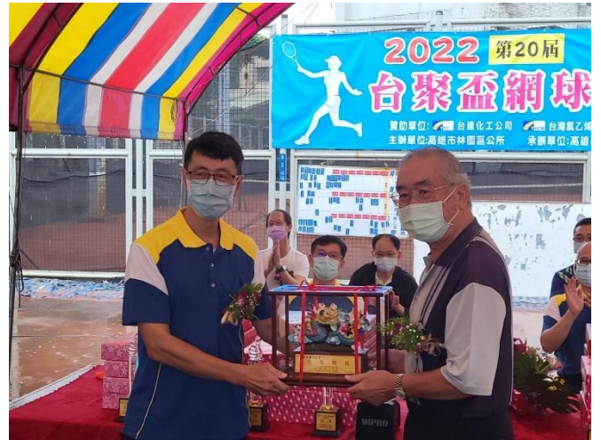
市議員代表感謝台達化林園廠贊助球賽