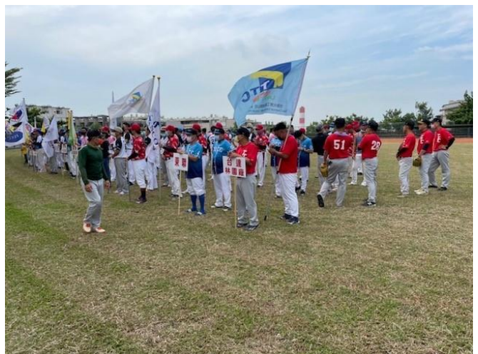
第 12 屆勞資和諧慢速壘球賽誓師大會