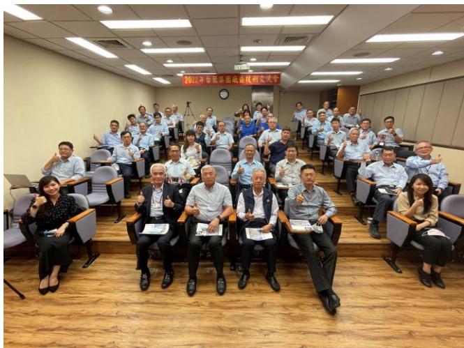
2022 台聚集團廠區技術交流會議人員合影

台達化頭份廠以「煙囪廢氣不透光率改善-靜電集塵器」作為技術交流案例，因位於環保署公告之空污防制區，且民眾對工廠維護良好的空氣品質與優質生活環境為關切的環保焦點。故頭份廠以增設空氣污染防治設備-靜電集塵器去除廢氣中微細粒子，大幅改善煙囪排放粒狀空氣污染物之問題，達到低污染、環保、永續經營等目標。經集團高階主管及發表廠區代表共同投票評分，台達化頭份廠榮獲集團廠區技術交流案例佳作殊榮，由吳董事長親自頒發獎狀，以茲鼓勵。