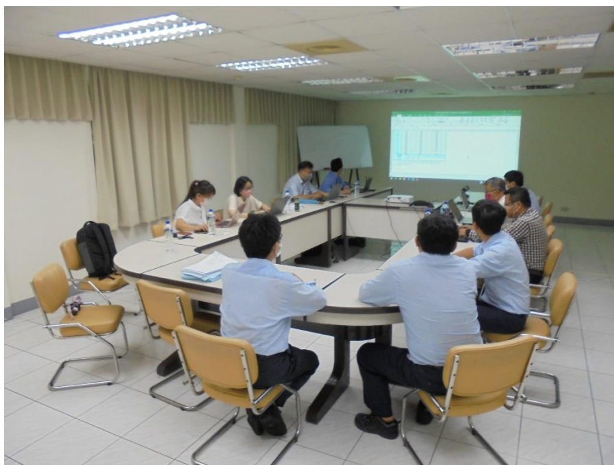
SGS 進行 14064-1 溫室氣體排放查證作業

因應全球暖化造成氣候變遷加劇且響應國家政策推動，台達化公司自 6/9~6/26 期間委由 SGS 公司針對頭份廠、林園廠及前鎮廠實施 2022 年度溫室氣體排放查證作業，期望透過外部查證單位，以利掌握廠區溫室氣體排放情形，進一步擬定 2030 年減碳 27%之計畫，持續朝向「淨零排放」為目標。