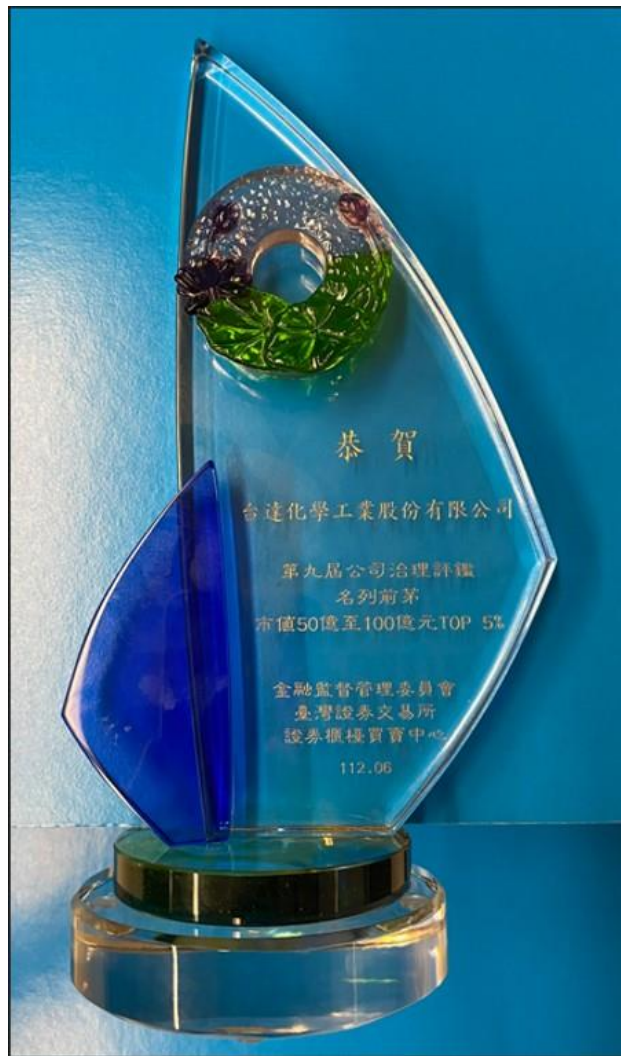
公司治理評鑑「市值 50 億元以上至 100 億元」類別排名前 5%獎牌