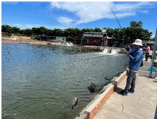
同仁開心參與釣魚活動