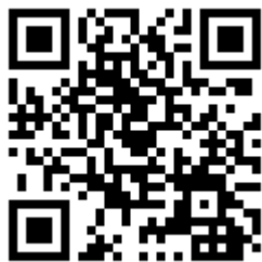
台達化 ESG 專區