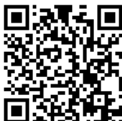
台達化 ESG 粉絲頁