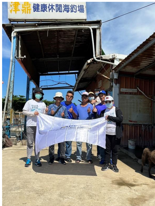
參與釣魚活動同仁開心合影

台達化公司持續推動健康職場之理念，期望同仁在工作之餘，能有適當的休閒活動。台達化頭份廠擁有豐富的社團活動，是增進同仁情感交流及提供正當休閒活動的好管道。秉持：給魚吃，不如讓他學會釣魚的理念，特舉辦釣魚活動，創造精采豐富的生活、培養樂活的生活態度。