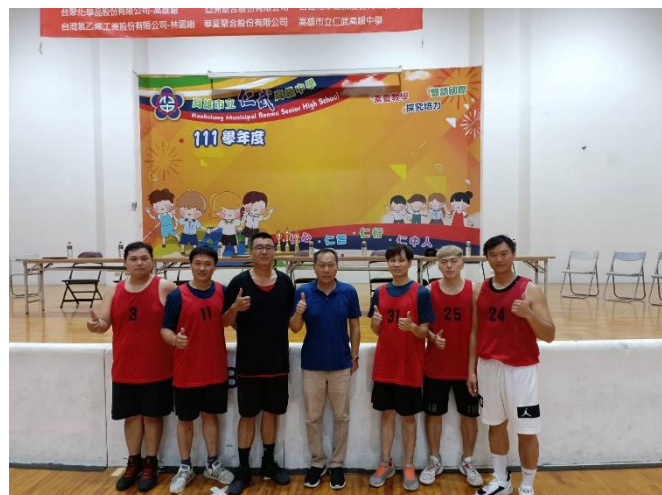
參與公益籃球賽同仁與前鎮廠王廠長(中)合影