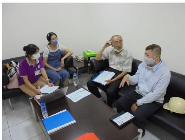
特約醫護人員辦理臨場健康服務諮詢