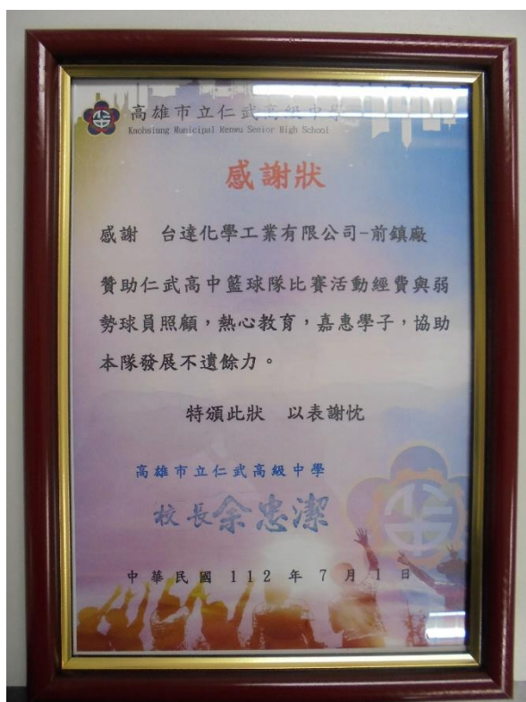
仁武高中籃球隊感謝狀