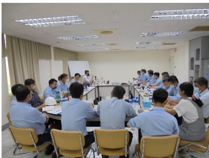
ISO 管理系統定期追查稽核

台達化公司在追求永續經營的基礎下，於 7/4、7/6 及 7/7 委由 SGS 公司完成頭份廠、前鎮廠及林園廠之 ISO 9001/ISO 14001/ISO 45001 管理系統定期追查稽核，期望透過導入(1)ISO 9001 以提供給客戶滿意的產品品質與服務，(2)ISO 14001 以提供良好的環境保護架構、控制與減少對環境的衝擊，(3)ISO 45001 以降低安全衛生風險、預防職業災害，提升安全衛生績效，持續以「PDCA」管理循環原則，不斷追求持續改善。