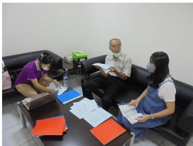
特約醫護人員辦理母性勞工健康保護評估

台達化前鎮廠持續落實職場健康管理，除規劃年度健康檢查結果風險因子較高之同仁健康諮詢服務外，亦協助辦理異常工作負荷疾病預防及母性勞工健康保護評估，期望提昇員工健康自主管理能力，往健康職場方向邁進。