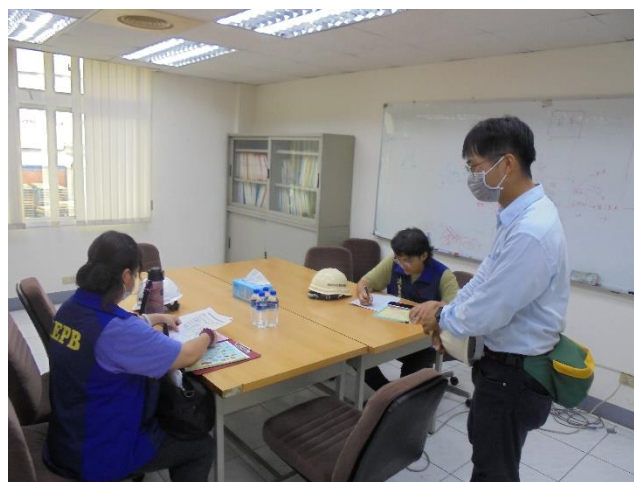
設備元件文件查核作業