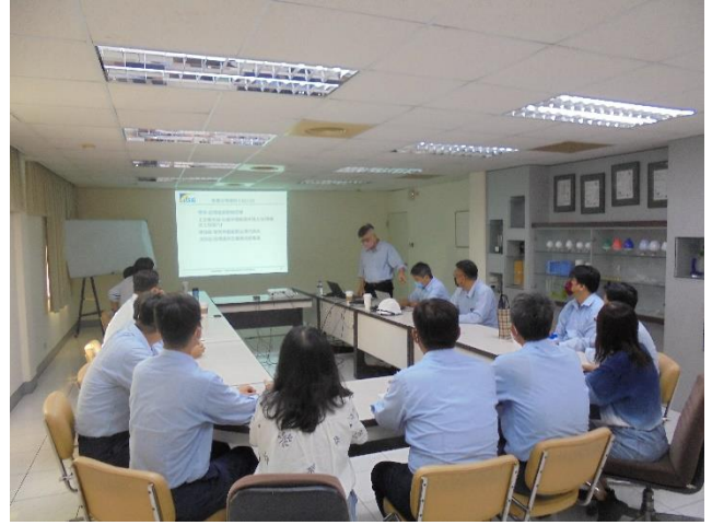
設環處安環管理稽核情形