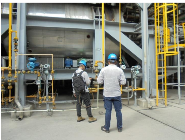
廠區設備元件抽測作業

台達化前鎮廠於 10/17 配合高雄市環保局、委辦公司及檢測公司進行設備元件抽測作業，合計共抽檢 300 點，且同時進行 FLIR 紅外線氣體顯像儀測漏作業，其檢測結果均查無洩漏。