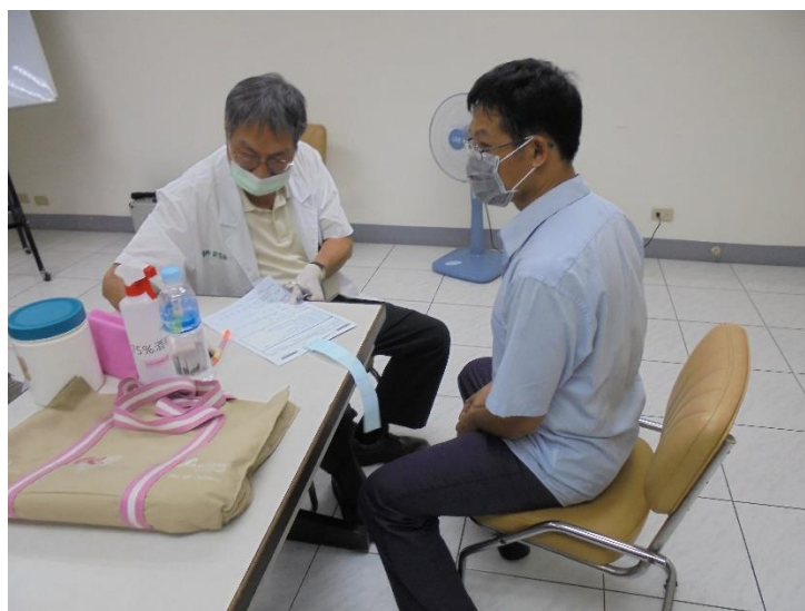
年度員工健檢醫師問診

台達化公司秉持「員工為公司最重要資產之理念」，且致力於建構健康且友善職場，故於每年度均會辦理優於法規要求之員工健康檢查及項目，前鎮廠於 10/14 及 10/16 辦理兩梯次員工健康檢查，健檢後提供每位同仁可向臨場專業醫護人員諮詢之服務，使同仁能更為瞭解身體狀況，達到早期發現早期治療之目的。