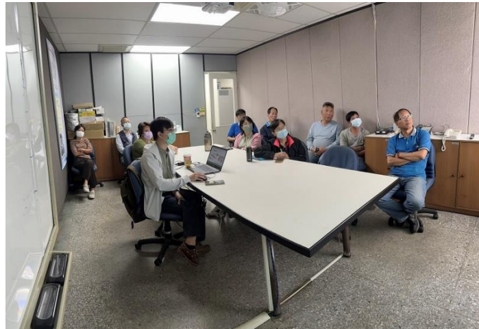
辦理職場健康講座

台達化頭份廠秉持健康的員工是企业組織最重要的資產，且每位員工一生中約有 1/3 時間處於職場中，如員工未受到健康的工作環境保護，長期累積下來，員工將可能有壓力、傷害、疾病、殘障或死亡等健康危害情形發生，同時也會造成企業組織生產力及形象的損失。因此，完善健康的職場將有助於員工免於遭受健康相關危害，進一步提升整體企業競爭力，使組織與員工皆能獲得成功。