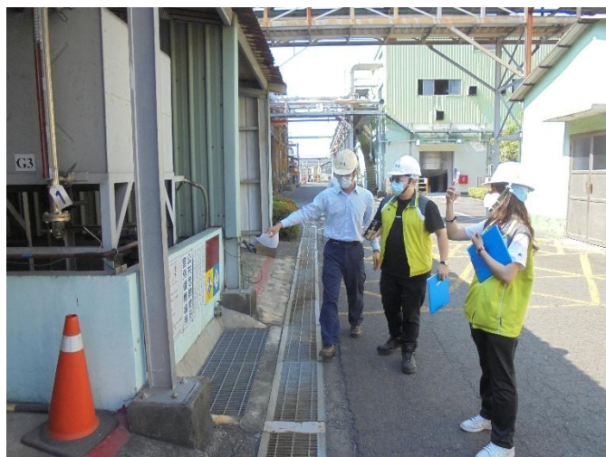
高雄市經發局現場查核作業