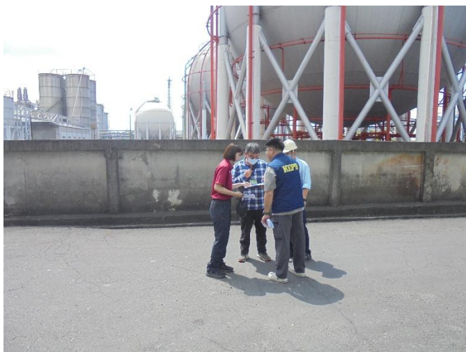
高雄市消防局及環保局現場查核作業

高雄市消防局為強化轄內工廠公共危險物品場所管理安全，於 3/24 由高雄市消防局、勞檢處、環保局及經發局派員進廠執行聯合檢查督導作業，消防局主要查核消防檢修申報書、公共危險物品自主檢查表等文件，並至現場實際抽驗偵煙警報器、測試消防泵浦及消防砲塔；勞檢處主要查核槽區危害標示及 SDS 符合度；環保局主要查核廢棄物申報及廢棄物貯存區符合度；經發局主要查核危險物品申報數量與實際存量之符合度，其各項檢查皆符合規定。最後期盼業者重視「平時重於災時」防救災觀念，加強自我防災應變工作，以落實職業安全衛生檢查並確保工廠不會發生火災、工安、環保等事故，保護員工及鄰近廠區安全。