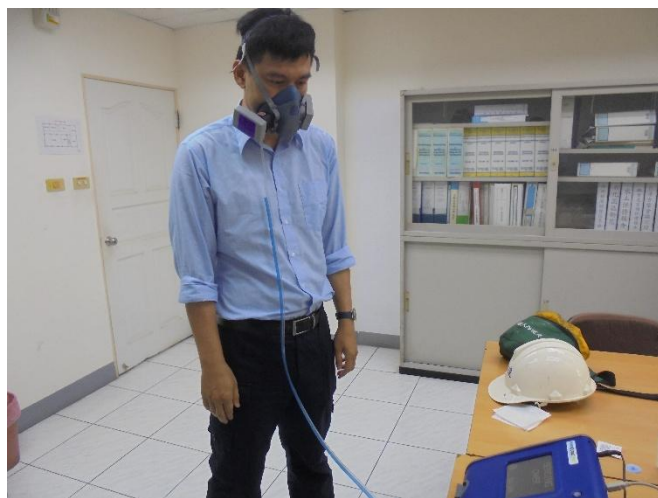
同仁實施呼吸防護具密合度測試作業