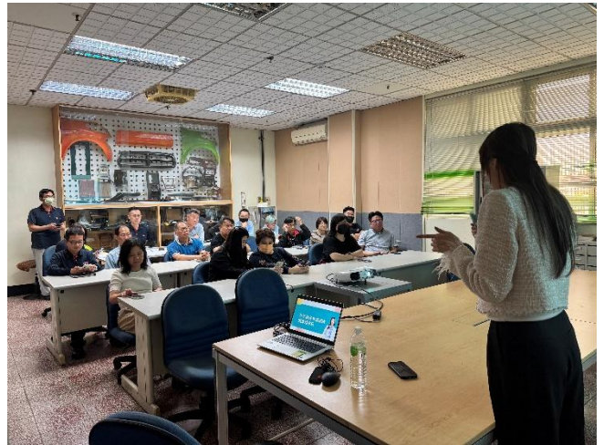
不法侵害教育訓練與溝通技巧課程