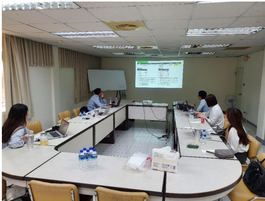
台達化公司 ESG 報告書確信作業

故於 4/8~4/10 假台達化前鎮廠委由勤業眾信聯合會計師事務所擔任第三方確信單位，針對 GRI 準則符合性進行審閱，並依循確信準則 3000 號，執行 5 項 ESG 指標之有限確信作業，藉由第三方查驗核實報告書中之數據，提升數據之可靠性與完整性，落實「數據永續」之願景。