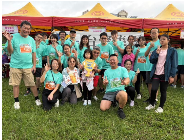
參與「台北科技盃」公益路跑同仁開心合影留念

透過汗水重新認識每日奮鬥的土地，是愛地球最簡單也最深刻的方式。每一位完賽者最終獲得了榮譽獎牌與完賽禮，也帶回了對內湖科技園區全新的感悟與身心舒暢的活力。