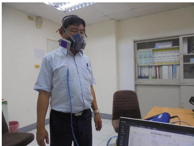
同仁實施呼吸防護具密合度測試作業

台達化前鎮廠持續落實員工職場健康安全，在每位員工入廠時均配給個人防護具，且為使員工有效的佩戴呼吸防護具，故定期教育訓練其正確的呼吸防護具佩戴方法，並規劃於 4/20~4/27 辦理呼吸防護具密合度測試作業，利用 TSI PortaCount Pro+ 專業儀器量測呼吸防護具與臉部皮膚密合度，確保員工於作業環境工作時，有害氣體能確實通過過濾裝置，達到防護效果，降低職業病發生機會。